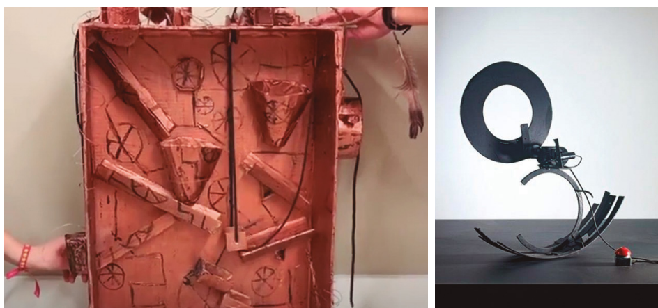
La obra diseñada por un grupo de alumnas (Fig. 3) que se inspiró en la obra de Jean Tinguely (1966) (Fig. 4) Fuente (Fig. 3): Elaboración propia. Fuente (Fig. 4): https://www.wikiart.org/es/jean-tinguely/santana-1966