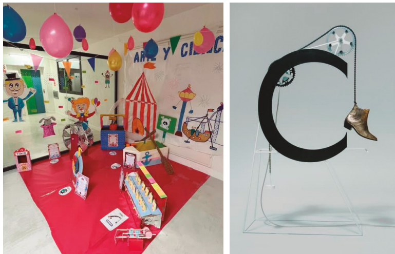
Figura 8: Parte de la obra del equipo "Espada y Santa Cruz"

La instalación realizada por el alumnado con temática circense (Fig. 7) tomó como referencia un lettering mecánico (Fig. 8) en el que el movimiento de los zapatos termina de componer el trazo de cada una de las letras