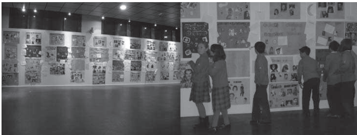
Figura 6. Los alumnos visitan sus trabajos «Catálogo de expresiones» y «Cambiamos la realidad»