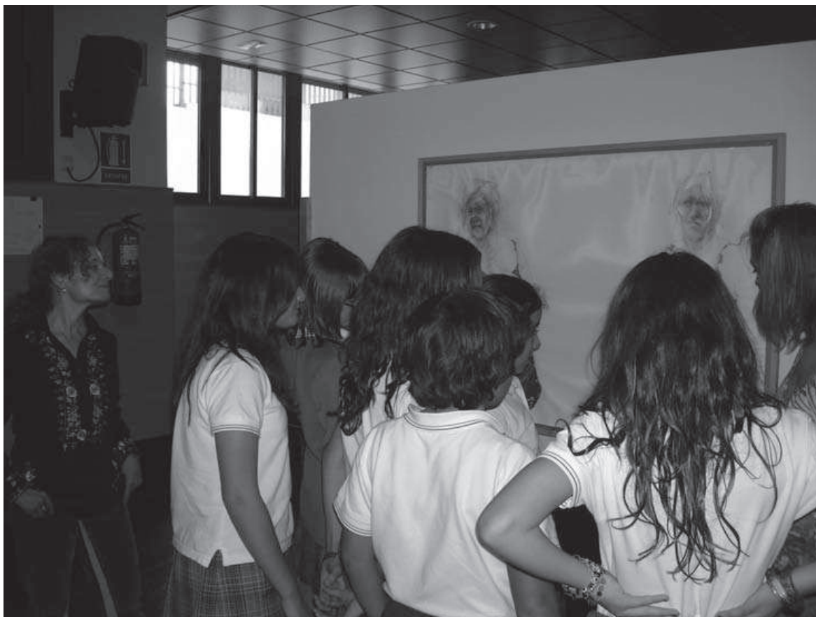
Figura 5: Los alumnos hacen preguntas frente a los cuadros.