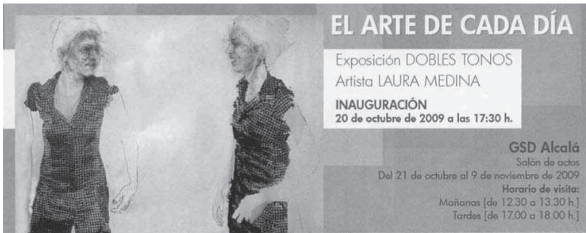
Figura 1: Invitación a la inauguración de Laura Medina e imagen del cartel anunciador.