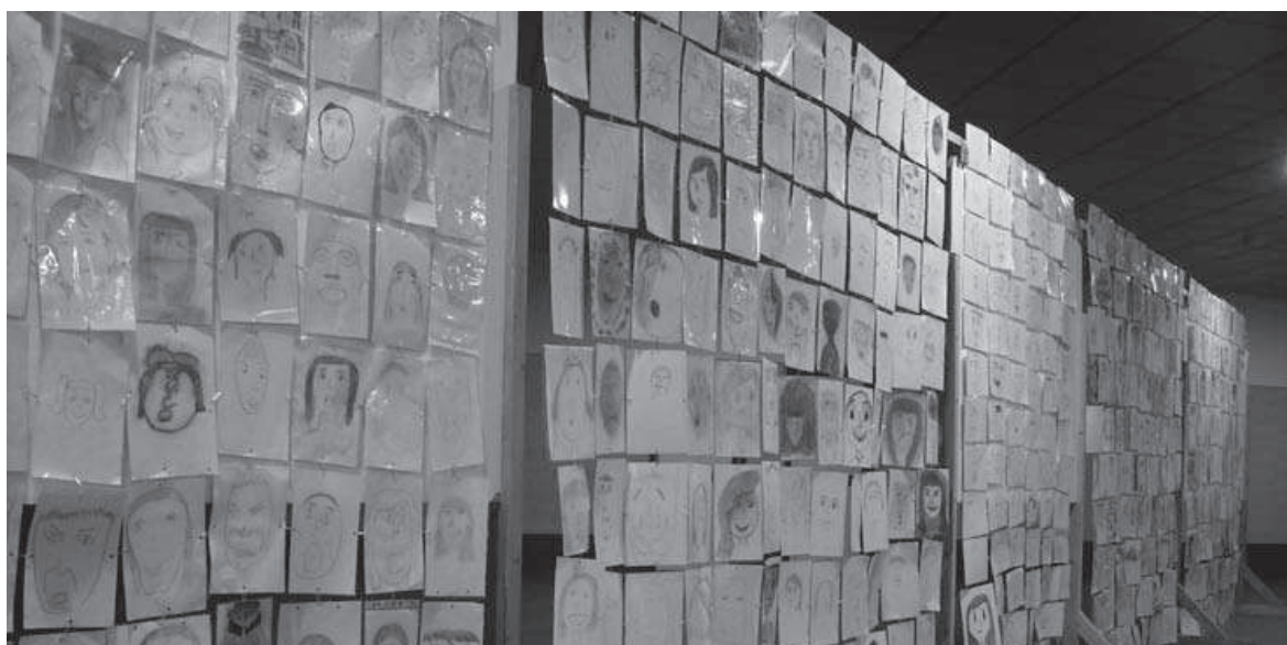
Figura 8. Los dibujos unidos por clips forman la cortina de expresiones.