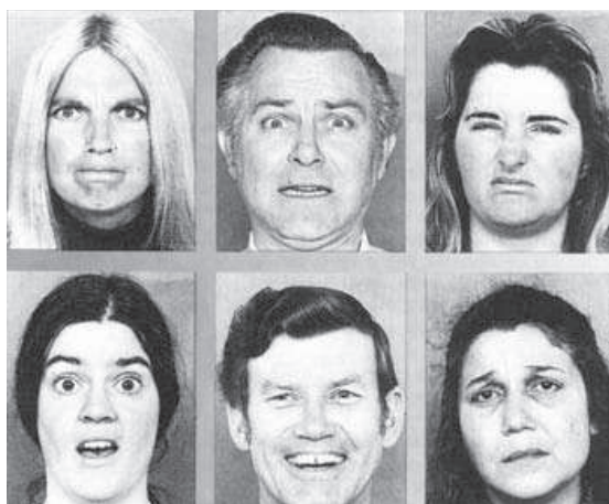
Figura A: Expresiones faciales según el psicólogo Paul Ekman.

Una de las cosas más asombrosas de estas expresiones faciales es que cualquier persona puede entenderlas independientemente del idioma que hable. Es como si se tratase de un lenguaje universal.