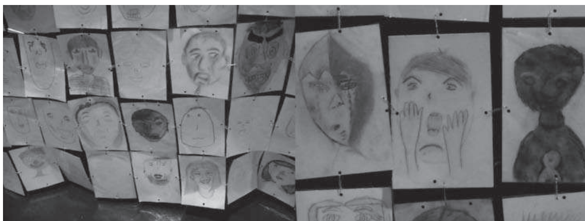
Figura 9. Podemos apreciar la variedad en los resultados finales de las pequeñas obras de arte.