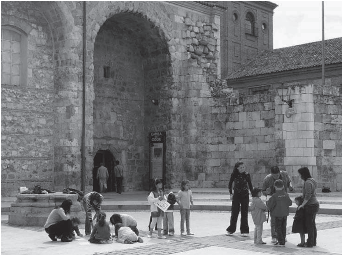
Fig. 1: Juegos en las ruinas de la iglesia de Santa María (mayo 2008).

organizados por instituciones públicas como los ayuntamientos o las administraciones autonómicas, que los subvencionan directamente o externalizan su puesta en práctica, dejándolos en manos de empresas y asociaciones subcontratadas. Así sucede que la duración de los programas es variable, al igual que las actividades que desarrollan, aunque por lo menos se mantienen dos características fundamentales: la primera es que suelen tener una intencionalidad educativa y de difusión cultural explícita, y la segunda es que pretenden promover la participación activa de los destinatarios mediante estrategias típicas de la animación sociocultural y la educación en el tiempo libre.