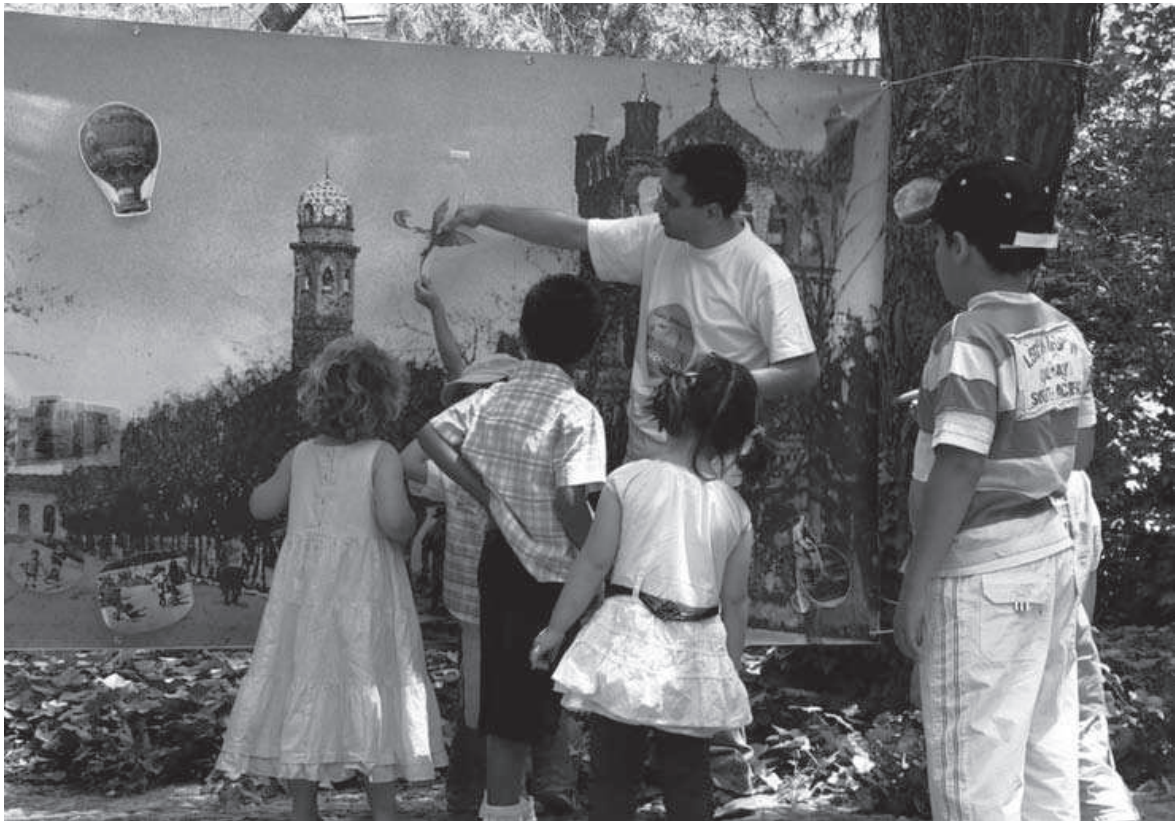
Fig. 3: Cuento-mural en el jardín del Palacio Laredo (junio 2007).

y medio de alto, que mostraba una fotografía del Paseo de la Estación en la época que se construyó el Palacio Laredo. Esta imagen resultaba muy sorprendente para los participantes, no sólo por sus dimensiones sino sobre todo porque el aspecto de esta calle y del propio entorno del palacio ha cambiado mucho desde entonces. Por consiguiente, lo primero que teníamos que hacer era ayudar a interpretar la fotografía comparándola con la realidad actual. Luego un cuentacuentos se presentaba con una carpeta de la que iba extrayendo retratos de personajes y objetos característicos de la sociedad del siglo XIX, por ejemplo un aguador, un soldado de caballería, un sereno, un labrador, un coche de caballos, un velocípedo, una locomotora de ferrocarril a vapor, un globo aerostático, un organillo y varias imágenes de niños jugando a juegos tradicionales como el aro, la carretilla, el caballito de madera, etc. La dinámica consistía en preguntar a los participantes si podían identificar qué o a quién representaba cada imagen, para después aclarar ideas y proponer comparaciones con la realidad actual. Así se intentaba hacer comprender la evolución de las sociedades en el tiempo, los cambios tecnológicos y las diferencias entre las formas de vida de ayer y de hoy.