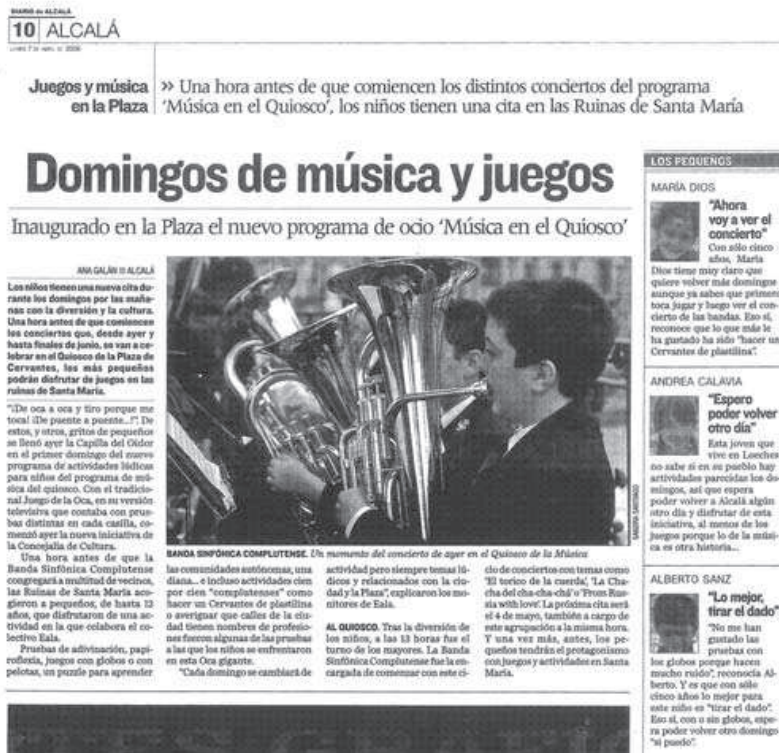
«Domingos de música y juegos», Diario de Alcalá (7 abril 2008).