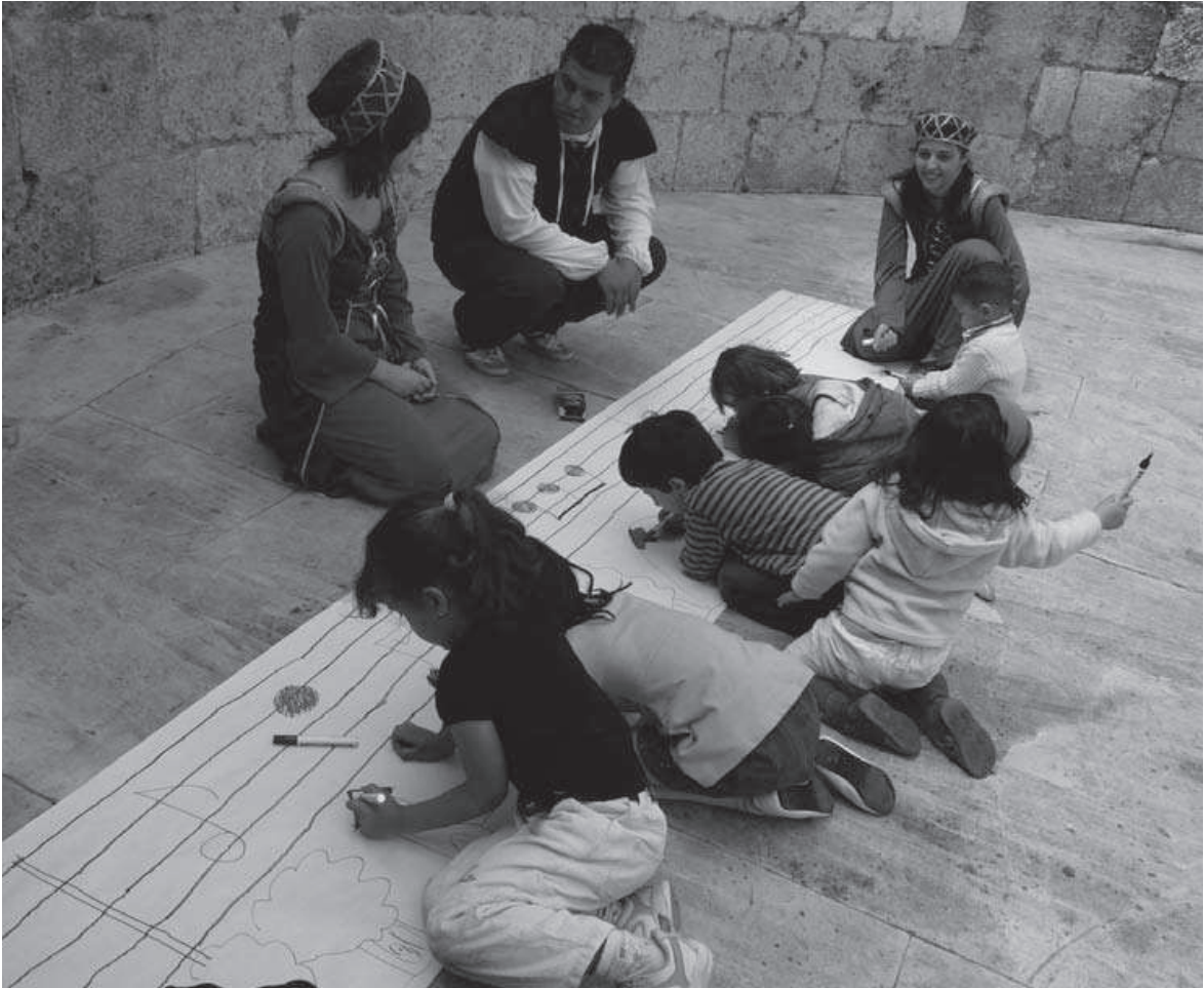
Fig. 10: Actividad relacionada con la música y los cuentos en las ruinas de la iglesia de Santa María (junio 2008).

intencionalidad educativa puede ser una estrategia fundamental para que las nuevas generaciones aprendan a valorar el patrimonio cultural como algo interesante y divertido al mismo tiempo. La buena acogida que las familias dispensaron a las actividades, y el hecho de que muchas personas repitieran su asistencia, son un claro síntoma de que existe una demanda creciente al respecto.