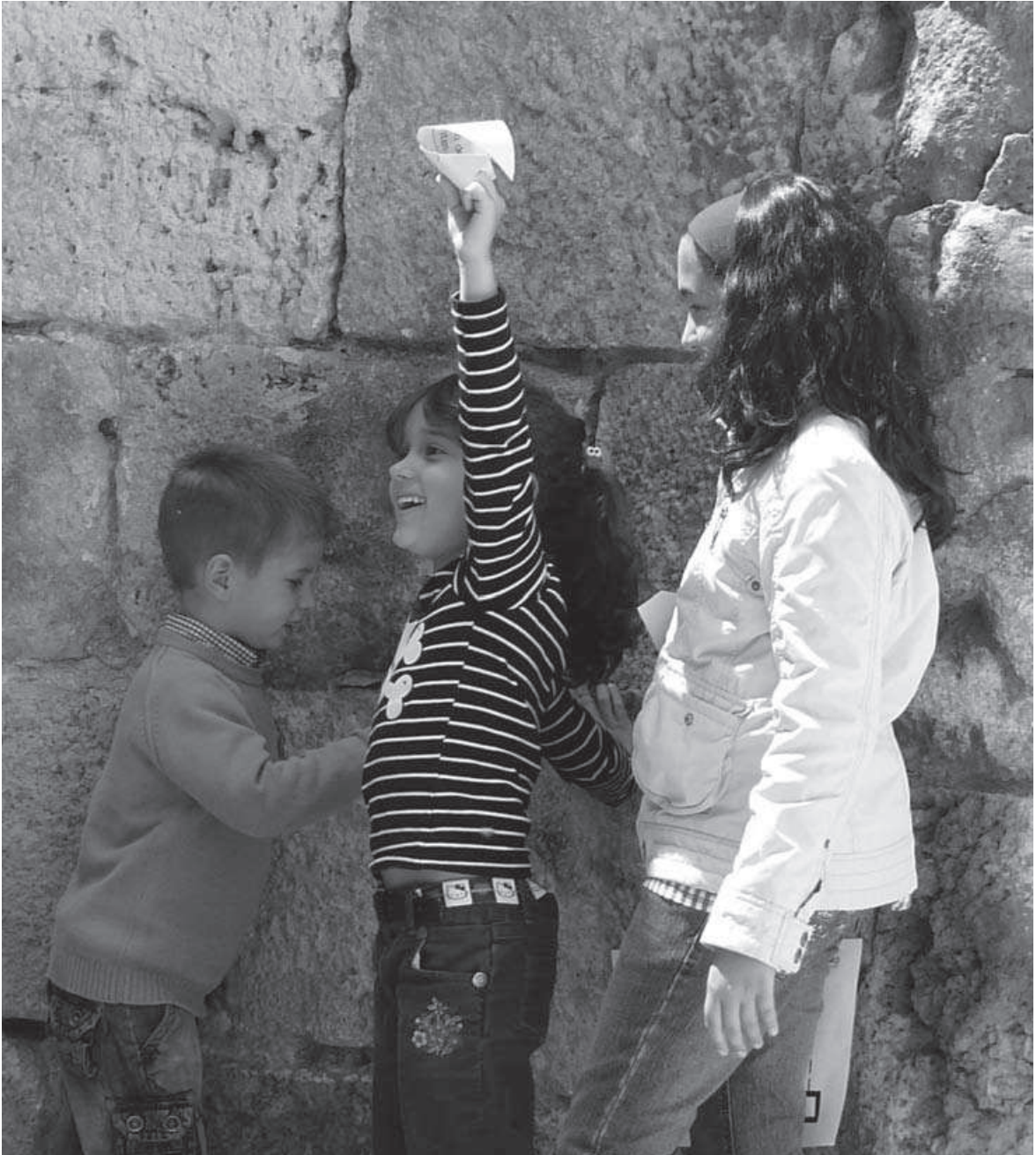
Fig. 8: Buscando fragmentos de la partida de bautismo de Cervantes entre las ruinas de la iglesia de Santa María (mayo 2008).

La actividad se desarrolló en dos partes. En la primera los niños realizaron un taller de fabricación de ratones con bolas de poliespan que pintaron y decoraron, añadiéndoles los detalles de las orejas y el hocico. A continuación pegaron los ratones sobre un enorme pentagrama dibujado en una larga tira de papel continuo, de forma que asemejaban notas musicales. En la segunda parte de la actividad dramatizamos el cuento del flautista con la colaboración de las familias. Éste apareció disfrazado a la