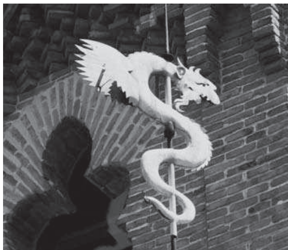
Fig. 4: Dragón de forja Art Decó que remata el tejado del Palacio Laredo.

época. Así resultaba una especie de ambientación del Paseo de la Estación tal como sería al poco tiempo de construirse el Palacio Laredo. Pero quedaba una sorpresa para el final. El último dibujo que extraía el cuentacuentos de su carpeta era un dragón surcando los cielos. ¿Qué hacía allí un dragón? El cuentacuentos les decía a los niños que, efectivamente, hace muchos años había venido a Alcalá un dragón que se había posado sobre el tejado del Palacio Laredo, y desde entonces se había quedado dormido y no se había vuelto a despertar. Acto seguido los monitores enseñaban a los niños el lugar donde se encontraba el dragón y les aconsejaban que guardasen silencio y se portaran bien si no querían despertarlo mientras visitaban el palacio. El dragón, en realidad, es un remate escultórico de estilo Art Decó , hecho de forja, que adorna todavía hoy el Palacio Laredo pero, en aquellos momentos, la imaginación de los niños se desbordaba.