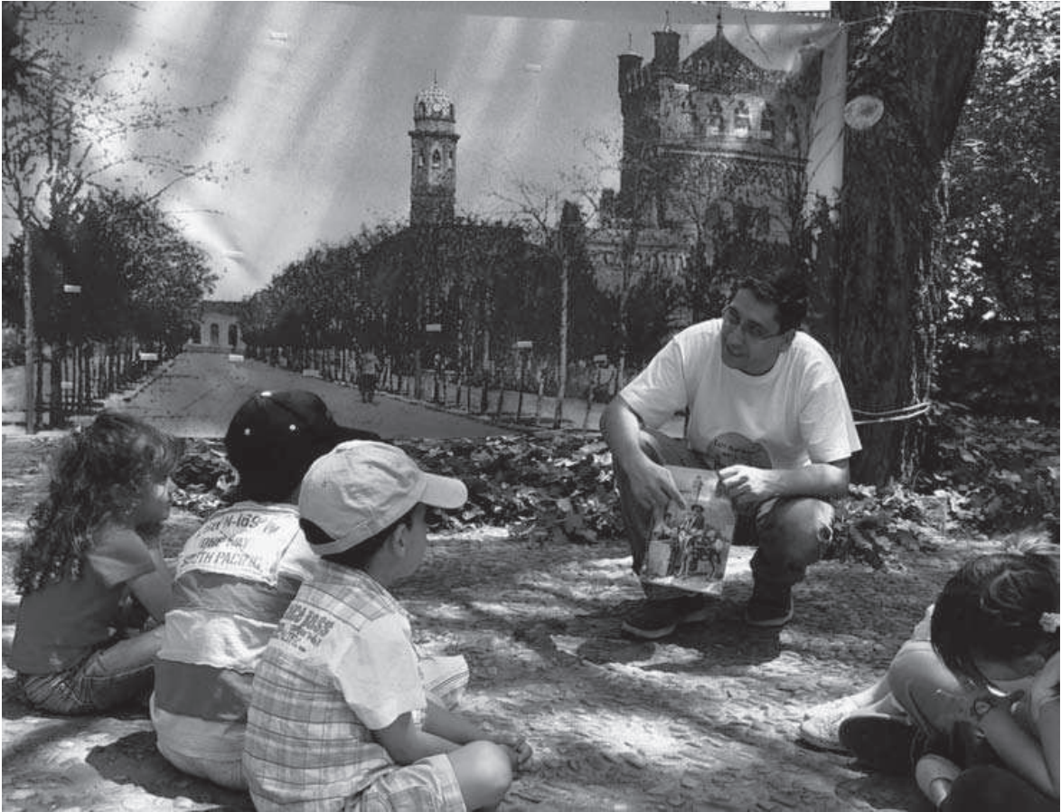
Fig. 2: Cuento-mural en el jardín del Palacio Laredo (junio 2007).

La metodología se basó principalmente en el modelo lúdico. Con el fin de proponer una oferta lo más atractiva posible, se utilizaron recursos didácticos muy diversos que permitieron conectar con un sector más amplio de destinatarios. El modelo de sesión, de una hora aproximada de duración, se iniciaba con algunos juegos cortos o técnicas de animación, para continuar con una actividad principal y finalizar con una actividad de despedida, de carácter plenario, en la que era habitual que participasen también los padres. De todas formas, la programación fue bastante flexible y experimentó algunas modificaciones o incorporó nuevas actividades, en función del tiempo, de la edad de los niños que asistieron cada día, de sus características y de otros factores. A continuación se enumeran los principales grupos de actividades desarrolladas.