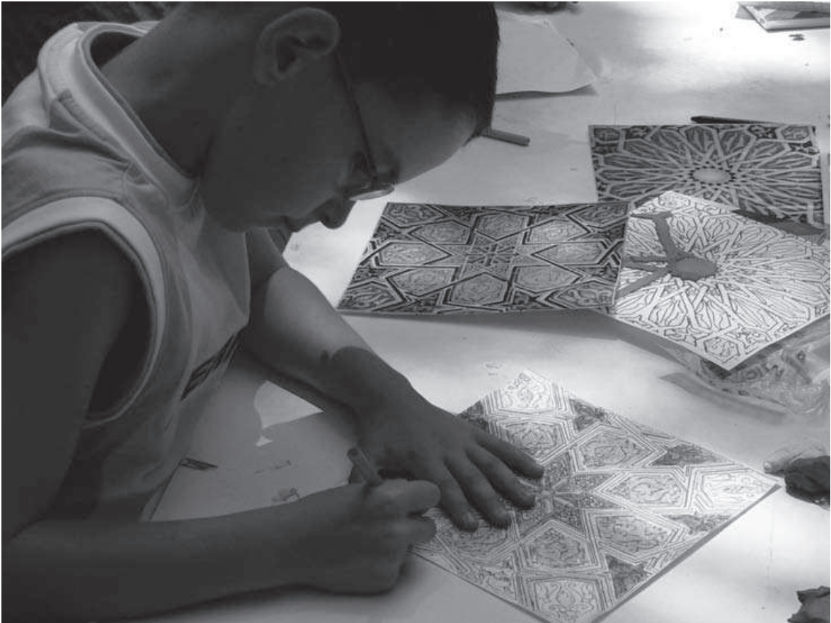
Fig. 6: Taller de azulejos en el jardín del Palacio Laredo (mayo 2007).

yeserías o azulejos, como los que hay en las paredes del palacio. Para los niños fue una forma de contribuir con sus propias manos a la decoración de un edificio tan singular.