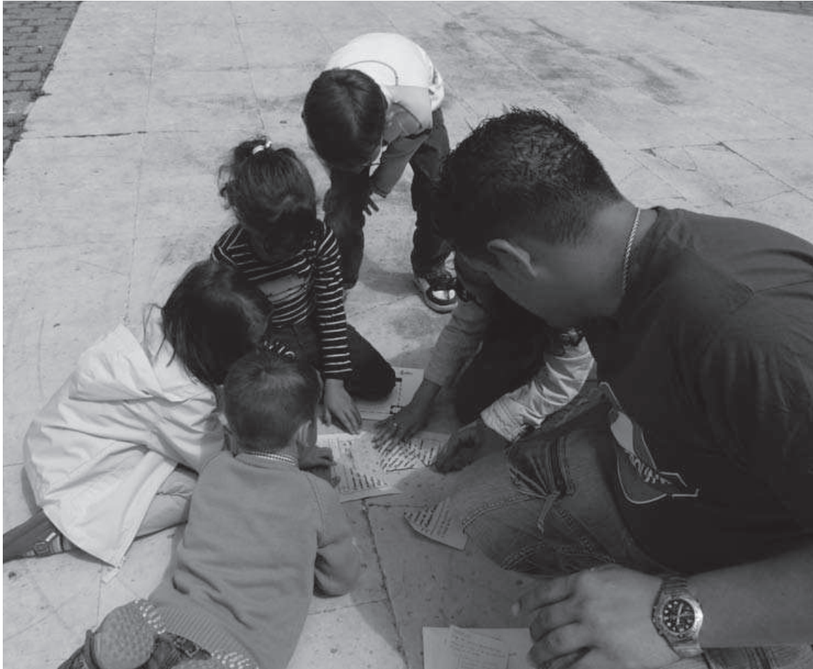
Fig. 9: Reconponiendo la partida de bautismo de Cervantes en las ruinas de la iglesia de Santa María (mayo 2008).

moda del Renacimiento y se enganchó la tira de papel continuo en el vestido. De esta guisa comenzó a tocar la flauta y a caminar, arrastrando tras de sí la tira de papel con los ratones hasta que desapareció de nuestra vista. Luego regresó y se llevó a los niños, que le siguieron en fila como hipnotizados por la música. Finalmente, los padres pidieron al flautista que les devolviese a sus hijos y, después de mucho negociar, todos se reunieron de nuevo y bailaron una canción de despedida. Tras ello se invitaba a las familias a acudir al concierto de música junto al kiosko de la plaza.