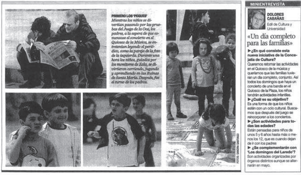
«Domingo de música y juegos», Diario de Alcalá (7 abril 2008).

» Ayer comenzó el ciclo con un recital de la Banda Sinfónica Complutense. Antes los niños pudieron jugar al 'Juego de la Oca' de la mano de los monitores de Eala