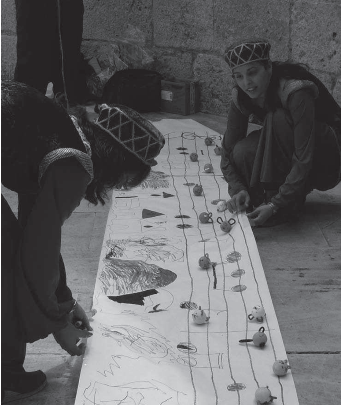
Fig. 11: Actividad relacionada con la música y los cuentos en las ruinas de la iglesia de Santa María (junio 2008).

Por otra parte, hay que reconocer que el impulso otorgado por parte del Ayuntamiento de Alcalá de Henares facilitó enormemente la gestión de ambos proyectos, y que la profesionalidad, creatividad y compromiso por parte de los monitores de EALA garantizaron en todo momento la buena marcha de los mismos.