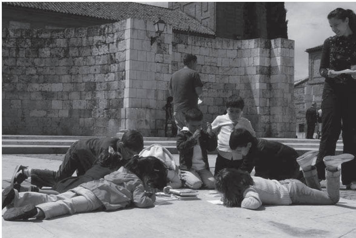
Fig. 7: Resolviendo el misterio de las ruinas de la iglesia de Santa María (mayo 2008).

reconstruir el puzle, podía leerse el texto de la partida de bautismo de Cervantes y, de esta forma, los monitores explicábamos el significado del sitio en el que nos encontrábamos. Como complemento a la explicación, repartimos a los niños un croquis y los guiamos por en medio de las ruinas, con el fin de ayudarles a comprender qué era cada uno de los elementos que se conservaban: los ábsides de la iglesia, los pilares que sostenían las bóvedas, la torre, la sacristía y las capillas laterales, en una de las cuales se halla la pila bautismal de Cervantes. A pesar de tratarse de un espacio arquitectónico cuya apreciación podía resultar un tanto abstracta, por su alto nivel de degradación, la verdad es que los destinatarios lograron interpretarlo correctamente.